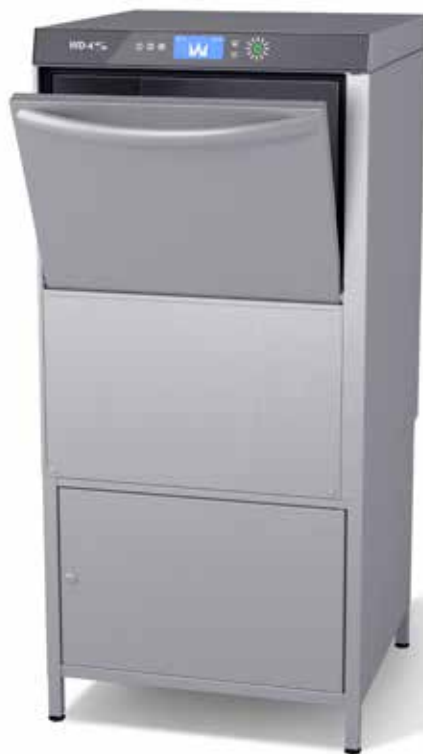
Både WD-4S BASIC och GLAS kan fås med understativ med låsbart skåp (alternativt understativ med öppet skåp).

Med en knapptryckning byter du enkelt ut vattnet för att växla från att diska smutsiga tallrikar till glas och brickor. Två funktioner i samma maskin sparar både utrymme och tid.