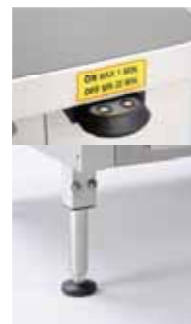
ELEKTRISK HYDRAULISK JUSTERING