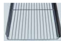
TRÅDHYLLA MED SKENOR